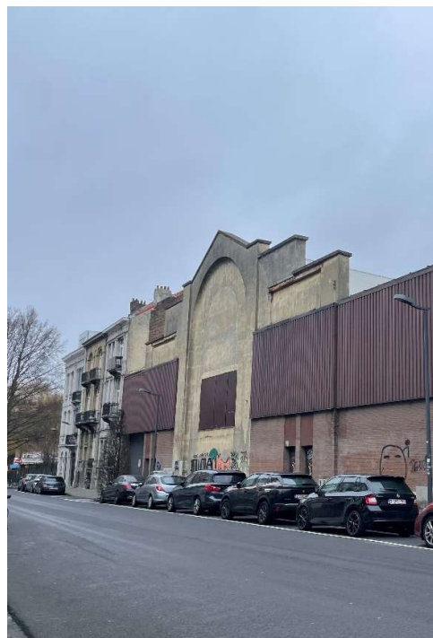
Fig. 01-03: Façade Chaussée de Waterloo