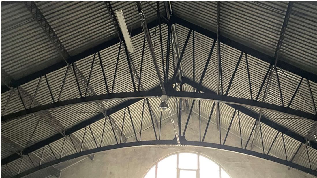
Fig. 16-19: Photos intérieurs